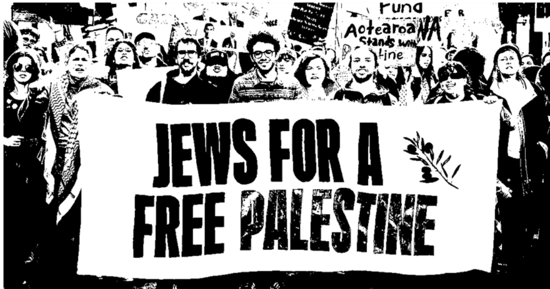
Billede af "Jews against occupation" fra New Zealand, 1. september 2024

Siden den 7. oktober er der sket en stigning i racisme rettet mod både palæstinensere, men også generelt mod arabere og muslimer: det der også kaldes for islamofobi. men alligevel er det ikke noget man hører om i nyhederne, men hvorfor?